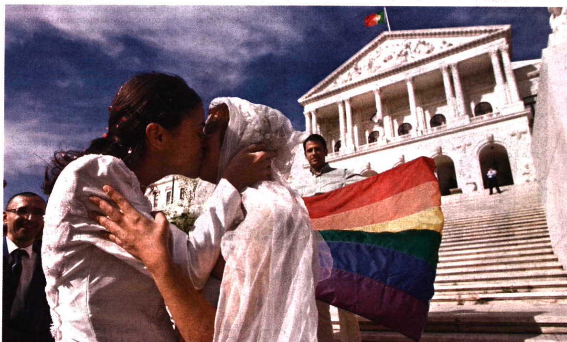
Enquanto os deputados chumbavam as uniões 'gay', encenava-se um casamento em frente à Assembleia